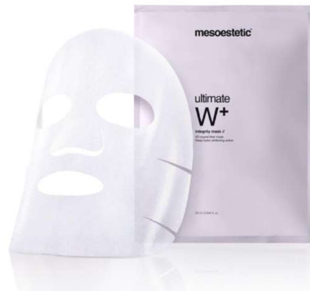
mascarilla de un solo uso · 25 ml Presentación: expositor dispensador (10 u)